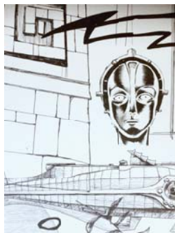
Alain Bardet Postcontinent 26 (détail), 2018 acrylique sur toile ©Alain Bardet

Disponibles sur demande au 027 324 11 39 ou par mail : g.metrailer@sion.ch