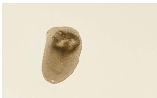
Anne-Chantal Pitteloud architecture utopique, 2018 vidéo HD ©Anne-Chantal Pitteloud