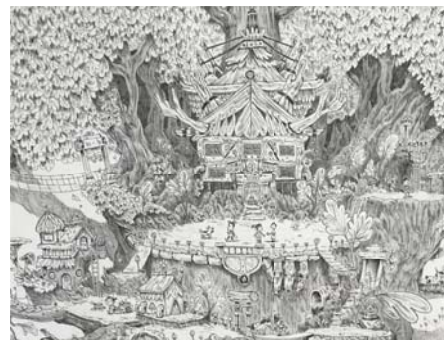
Clément Di Chirico vivre en utopie, l'arbre dans le ciel (détail), 2018 Rotring et crayon graphite sur papier ©Clément Di Chirico