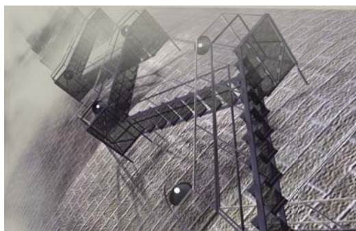
Xavier Cardinaux L'escalier (screenshot), 2015 animation 3D, vidéo 1080i, séquence en boucle ©Xavier Cardinaux